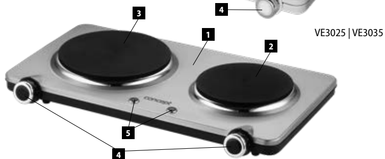
VE3025 | VE3035